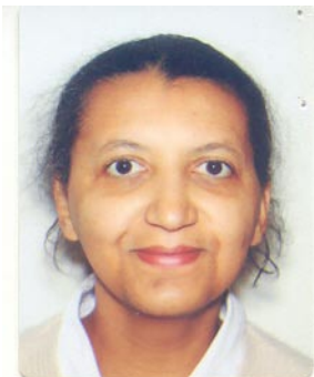
Marine ISSUMO Associée - Gérante

839, avenue Mama Yemo Lubumbashi, Katanga Tél.: +243 99 99 83 150, +243 99 58 26 417 E-mail : mephartech@mephartech.com